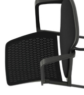
Brazos fijos Braços fixos / Accoudoirs fixes / Fixed arms / Festen Armlehnen