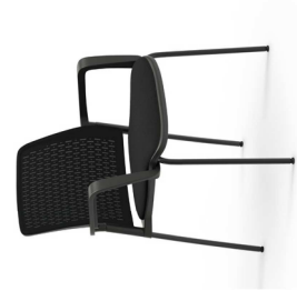
4 patas 4 potes / 4 pieds / 4 leg chair / Besucherstühle.